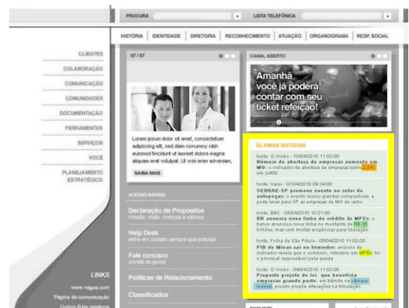
A webpart ESQUILO NOTÍCIAS pode ser usada de uma forma simples, como parte de uma página existente

Para utilizar o ESQUILO, basta instalar as webparts desenvolvidas pela Cortex, selecionar seus temas de interesse, posicionar a webpart na página desejada e pronto! Seu site SharePoint já exibirá os últimos acontecimentos do mercado e seus usuários poderão analisar e colaborar sobre todo esse conteúdo. As webparts podem ser utilizadas tanto de uma maneira mais simples, por exemplo, como parte de uma página SharePoint já existente, ou como foco principal da página, onde o usuário contará com diversos recursos de análise e mineração de informações e colaboração.